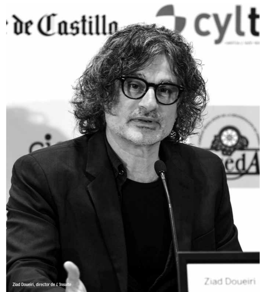
Ziad Doueiri, director de L'Insulte