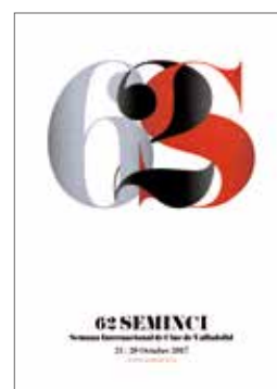
CATÁLOGO 62ª EDICIÓN

El cine islandés protagoniza uno de los ciclos de la edición, que reúne un buen número de trabajos realizados en un territorio tan inhóspito como fascinante. Este volumen sirve como fuente complementaria para conocer en profundidad la labor de sus cineastas.